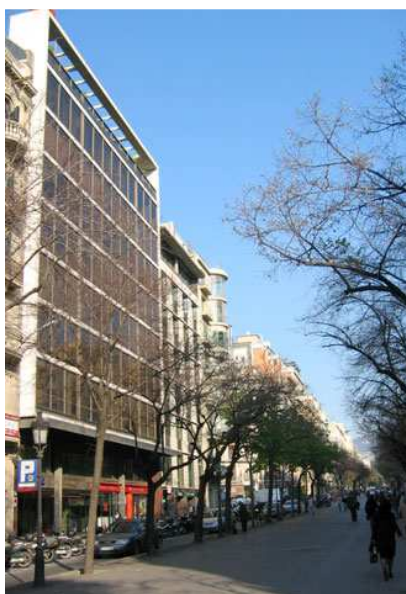
Edificio en el que se ubica FraLucca en Barcelona